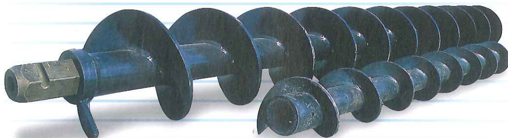
オーガースクリュー