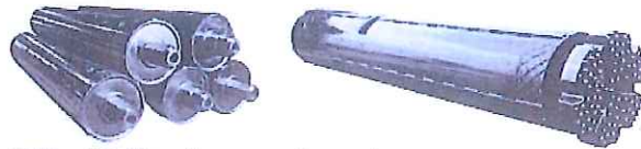
中間ケーシングロッド