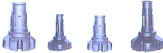
ダウンザホールハンマービット